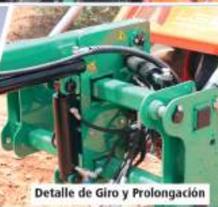
Detalle de Giro y Prolongación