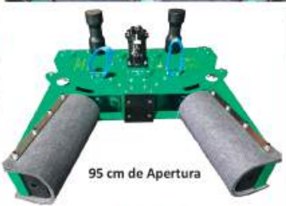
95 cm de Apertura