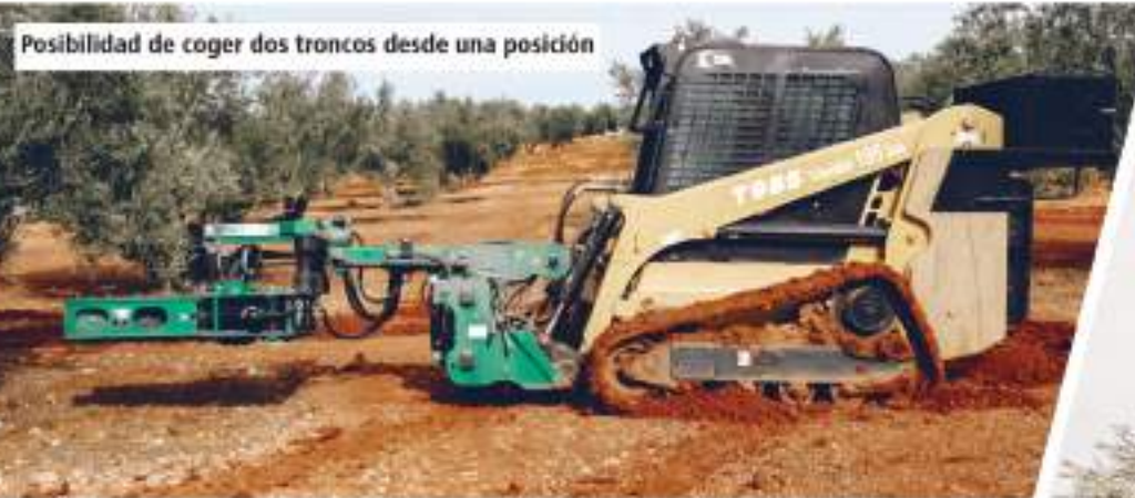
Posibilidad de coger dos troncos desde una posición