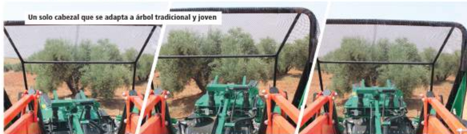
Un solo cabezal que se adapta a árbol tradicional y joven